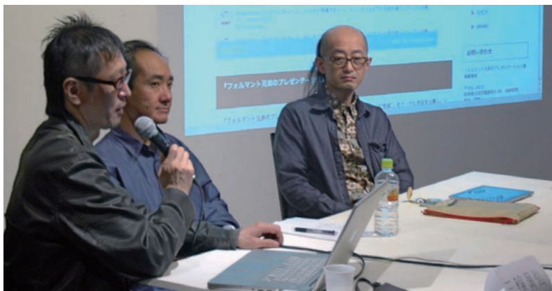
■ATカフェでのイベントでは、兄弟の作品紹介と、メディアアートにまつわる諸問題についてトークを行った