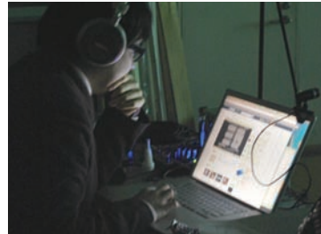
■ Ustreamの画面を見ながら演奏をコントロールする

ターティメント』というものへのあこがれがある。前作の政治性やメッセージ性よりも、今回は twitter の持つリアルタイム性と参加性を重視し、楽しんでもらえる作品を目指した」(松本)。