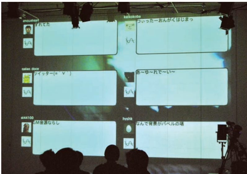
■ twitterにアクセスした6人分のテキストが品詞分解され、音楽に変換される