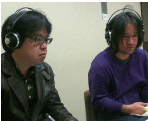
■公募作品の選考会は東京都内の会議室で行った