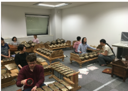
レクチャー（練習）風景 5/22

20回のレクチャーを実施。延べ180人以上が参加。前年度から参加しているメンバーをコアに、ガムラン未経験者が加わり、楽団を維持し、その成果を「IAMASオープンハウス」「養老アートピクニック」「岐阜おおがきビエンナーレ」「IAMAS2020」において発表した。