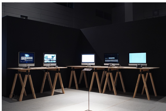
IAMAS 2020 プロジェクト研究発表会 タイムベースドメディア2020展