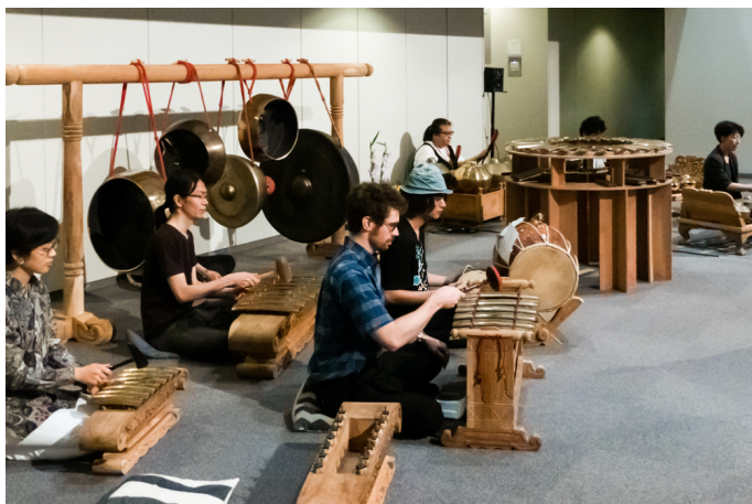
IAMASガムラン楽団演奏（岐阜おおがきピエンナーレ）