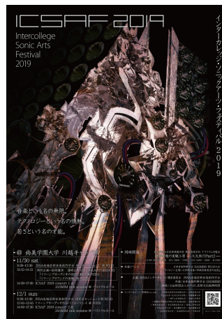
インターカレッジソニックアーツ・フェスティバル