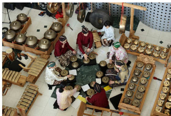
タイムベースドメディア・ガムランコンサート ソフトピアジャパン・センタービル1F ふれあい広場