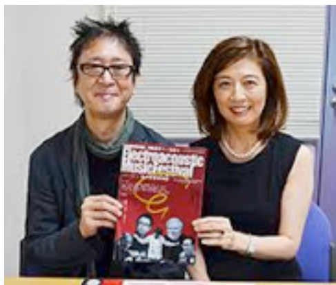
サラマンカ電子音響音楽祭 プロモーション