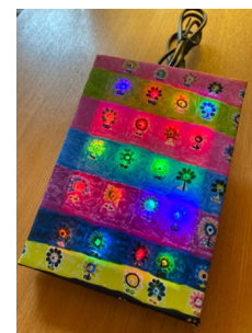
図 4 イルミフレーム

知的障害の方など発話がはっきりしない方が対話する時、慣れていない方が発話内容を聞き取ることが難しい。場合によってはその後のコミュニケーションにも影響が出てしまうことがある。そうした影響を減らすことを目的に、自動音声認識技術を使ったテキスト提示方法について検討を行った。（山田）