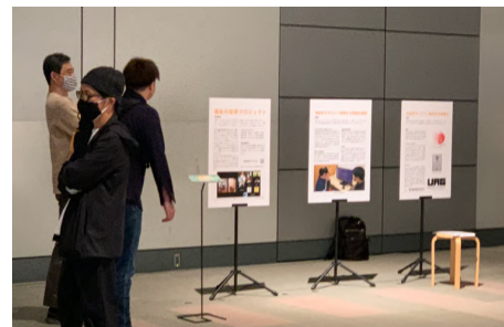
図 2 プロジェクト研究発表での展示