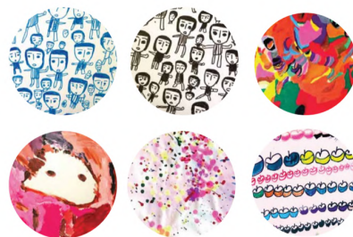
図 3 検討した作品例

参加された施設の方より、施設利用者が日々制作している絵などの作品をきっかけに利用者や施設を知ってもらうことを目的としたプロダクトを考案・検討している。右の写真は対象となった作品例である。（小林）